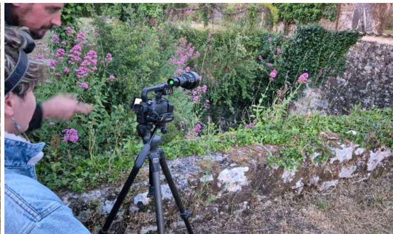
Comptage à l'envol avec caméra infrarouge Carrière en Charente-Maritime