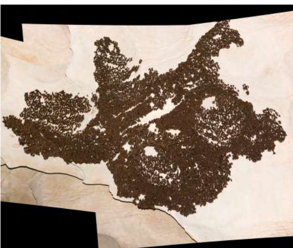
1, 2, 3, 4... 20 000 minioptères en hibernation Grotte naturelle en Occitanie (2024)

Ce logiciel s'avère particulièrement adapté aux comptages hivernaux, lorsque les chauves-souris sont regroupées en essaims compacts. En procédant par échantillonnage d'une portion de l'image, CountEm extrapole le total sur l'ensemble de la photo et fournit une estimation accompagnée d'un taux d'erreur.