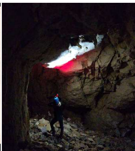
Comptage à vue Carrière en Bourgogne