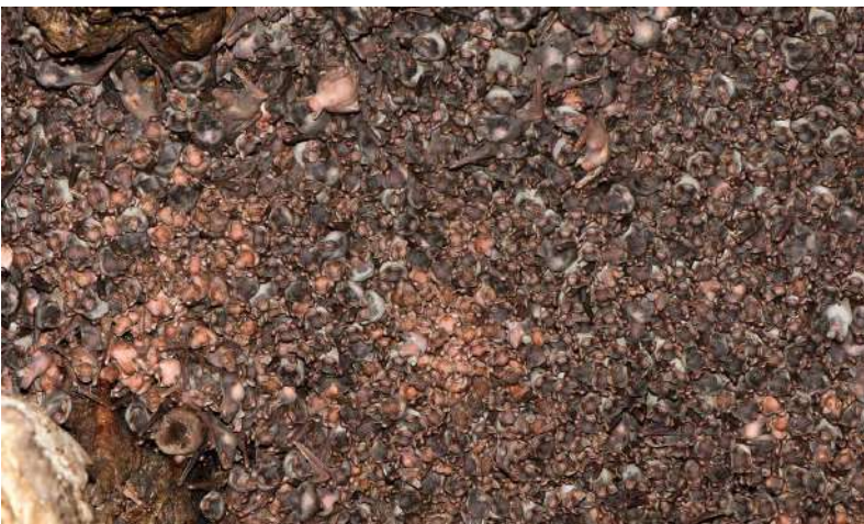
Colonie de femelles Miniopères avec des jeunes au stade "crevette" Grotte en Occitanie